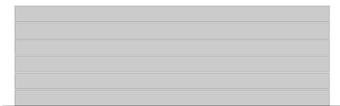
Rys. 3. Układanie bez przekładek i bez belki