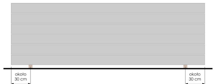
Rys 2. Układanie bez przekładek na belce